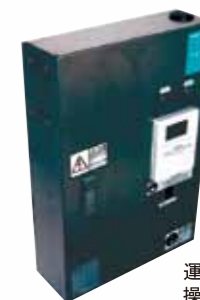
運転切換え用 操作ボックス

■除菌効果が高まる六角形Body 銀イオン処理ステンレスBody 清潔なSUS304ステンレス