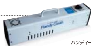
ハンディークリン