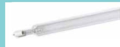
石英管大型オゾンランプ