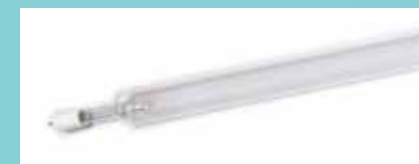
石英管大型紫外線ランプ