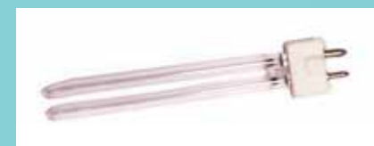
石英管小型オゾンランプ