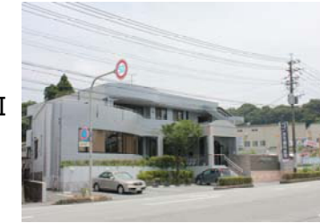
バクテクターjr設置写真