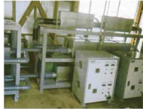
オゾン水シャワー(細霧ノズル使用)